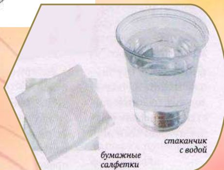
Баночка с водой