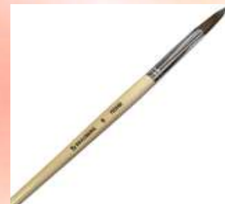
Кисточка для смачивания теста